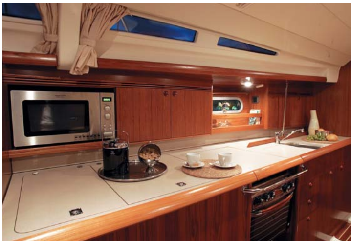
Cuisine version 4 cabine long galley in 4 cabin version