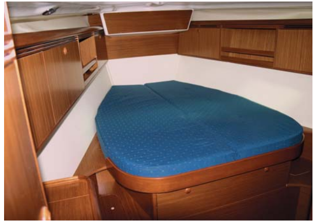
Cabine avant propriétaire Owner forward cabin