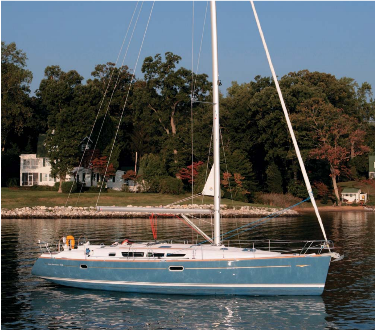
Hull colour not available Couleur de coque hors série

The highest level of standard equipment is the hallmark of this large cruiser. Double steering stations, well laid-out and spacious cockpit, flush deck plan with a myriad of deck hatches, and a classic, overlapping sail plan. Add high-tenacity sails with reinforcements and a silent and powerful motor to improve your performance under all conditions. Other factors that contribute to the comfort onboard are the wide side decks, which allow for easy movement on deck, as well as, the ample transom with cockpit shower and swim ladder.