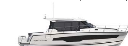
Merry Fisher 1095 Coupe

I | Apprezzerete anche il cockpit modulabile, le immense piattaforme di poppa su un unico livello, vero e proprio invito a tuffarsi, e il comodo prendisole di prua dotato di schienali reclinabili. A seconda dei programmi, è possibile ribaltare il sedile copilota per creare un ampio spazio conviviale nel quadrato. E per la notte, il sedile può trasformarsi anche in cuccetta!