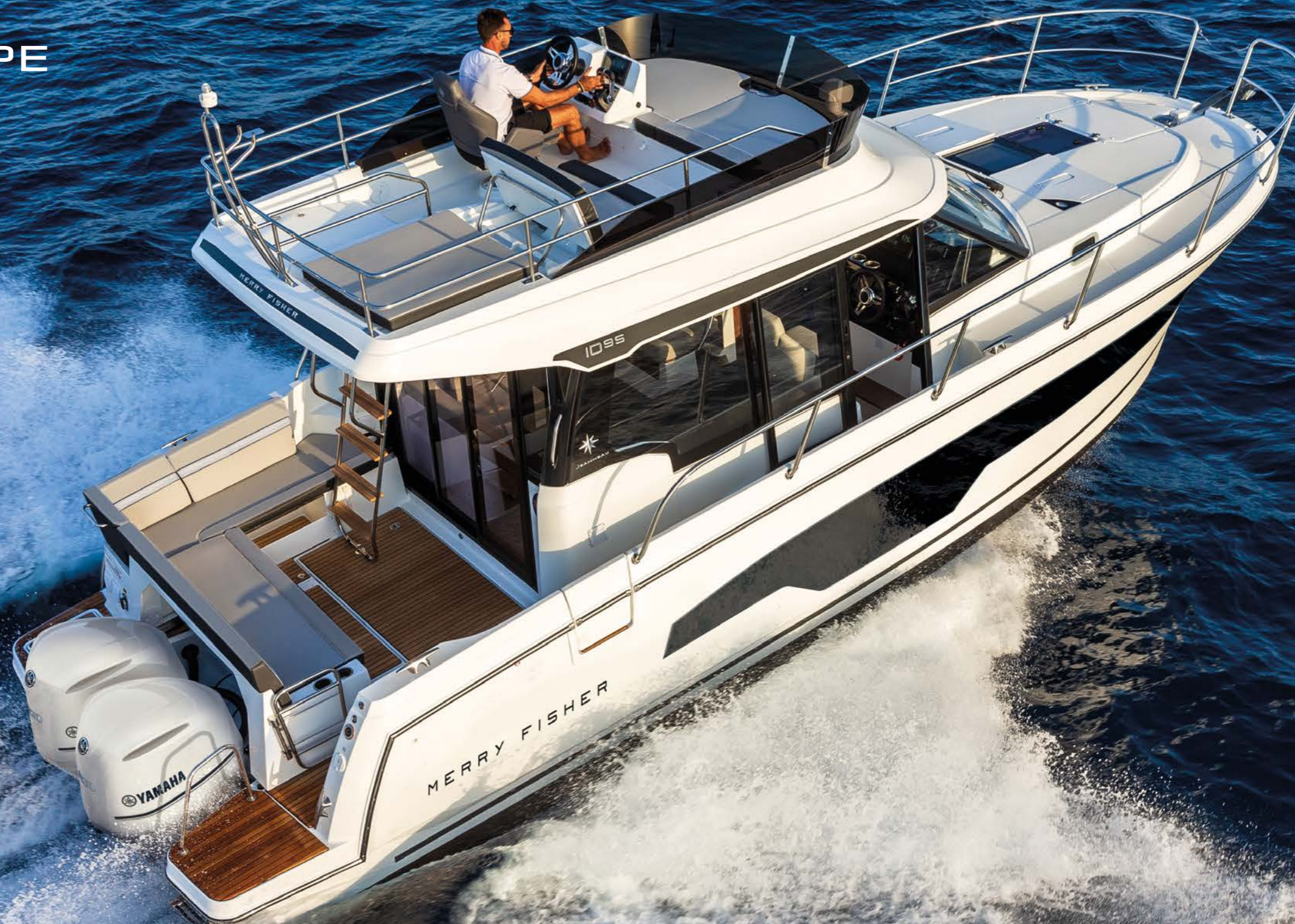
Merry Fisher 1095 Fly

EN | The Merry Fisher 1095 is a weekender and an ideal cruising boat for family outings, benefiting from an incredible volume of living space on board! On the exterior, every detail has been carefully considered for safety, comfort and relaxation. A sliding side door, recessed side deck and side access gate facilitate movement and access aboard.