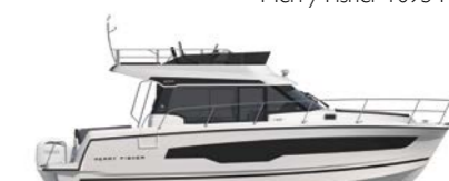
Merry Fisher 1095 Fly

I | Il Merry Fisher 1095 è un weekender e una barca da crociera ideale per navigare in famiglia, ed è dotato di volumi incredibili! All'esterno, tutto è pensato per la sicurezza, il confort e il relax. La porta laterale scorrevole, il passavanti a incastro e la porta di murata facilitano la circolazione e l'accesso a bordo.