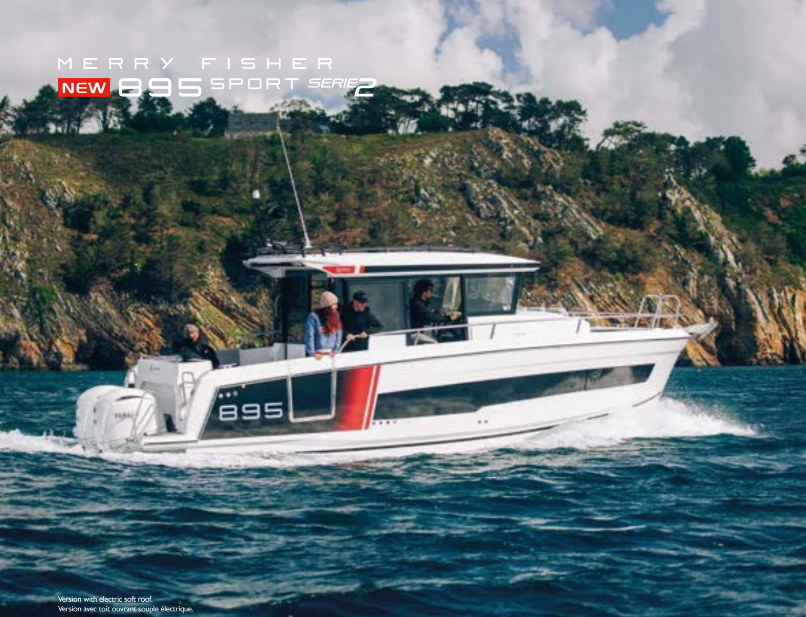
Version with electric soft roof. Version avec toit ouvrant souple électrique.