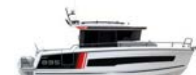
NEW Merry Fisher 895 Sport Serie2

I | Versatile e modulare, il Merry Fisher 895 Sport Serie2 permette di vivere tutte le avventure nautiche in totale connessione con la natura. Un'importante novità è l'ampio portellone laterale a dritta, piuttosto raro su imbarcazioni di queste dimensioni, che facilita il carico dell'attrezzatura e l'accesso all'acqua.